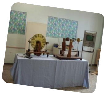
FisicLab via Guardia Nazionale n. 15 San Giovanni in Persiceto