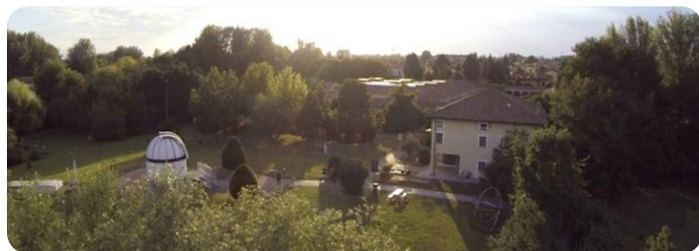
Planetario e Orto Botanico "U. Aldrovandi" vicolo Baciadonne San Giovanni in Persiceto