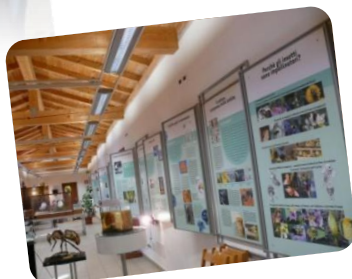
Laboratorio dell'Insetto via Marzocchi n. 15 San Giovanni in Persiceto