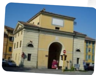
Museo Archeologico Ambientale - sede di San Giovanni in Persiceto - Porta Garibaldi, corso Italia n. 163